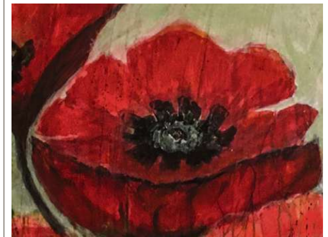
Ausschnitt aus dem Bild «Mohn» von Madeleine Hürzeler.